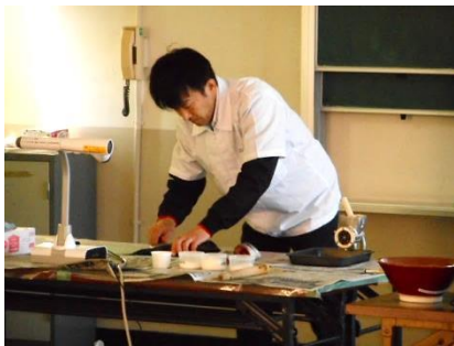
三枚おろしの実演です。

社会科の学習でヤマサの工場見学をした児童にとっては、より深い学びとなりました。日本の食文化の素晴らしさを実感できた時間でした。