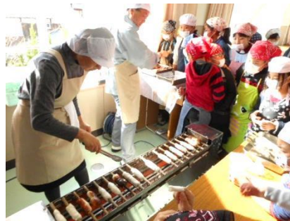
竹串に巻いて焼いています。