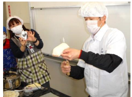
かまぼこも作ってもらいました。